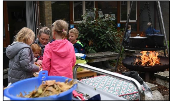
Der Kitaverbund St. Felizitas Lüdinghausen kocht in allen angeschlossenen Kitas frisch vor Ort.

Mehr zu dem Projekt auf den Seiten der DBU und der FH Münster