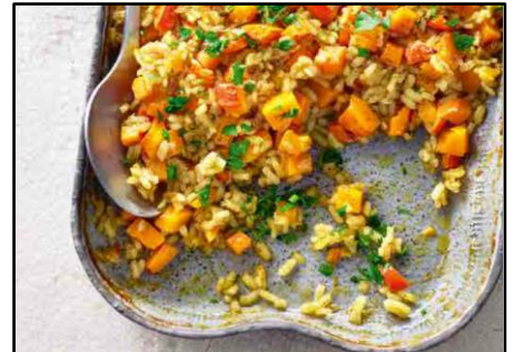
Kürbisrisotto aus dem Ofen

Den Backofen auf 175 °C (Umluft) vorheizen. Zwiebel schälen und in kleine Würfel schneiden. Kürbis waschen, Stielansatz und harte Stellen an der Schale entfernen, halbieren, dann Fasern und Kerne herauskratzen und ungeschält in ca. 5 mm große Würfel schneiden. Zwiebelwürfel und Kürbis mit Reis, heißer Brühe und Olivenöl in eine Auflaufform geben. Zitronensaft und -abrieb mit Zimt, Piment, Cayennepfeffer und Kräutersalz dazugeben und vorsichtig vermengen. Die Auflaufform abdecken (z. B. mit Alufolie) und im vorgeheizten Ofen 50 Minuten backen, bis der Reis gar, aber noch leicht bissfest ist. Während der Backzeit zweimal umrühren.