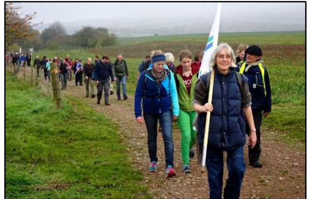
Im Spätsommer wird der Klimapilgerweg auch viele Gemeinden im Bistum Münster erreichen.

Wer mitpilgern will, kann ab 13.08.2021 in Polen mit an den Start gehen, oder sich auf einem beliebig langen Stück der Pilgergruppe anschließen. Dieses Mal steht der Klimapilgerweg unter den Schwerpunktthemen Mobilität und Landwirtschaft.